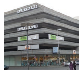
Parkhaus vor der Modernisierung