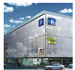
Visualisierung der Edelstahlgewebefassade