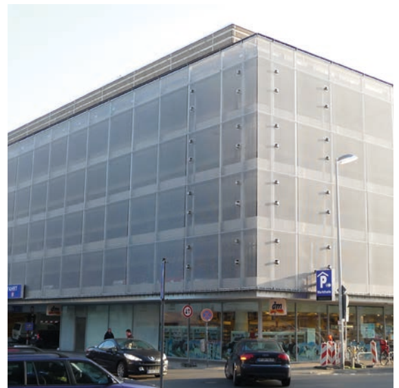
Parkhaus nach der Modernisierung

Die der SPECHT KALLEJA + PARTNER ARCHITEKTEN GmbH übertragene Modernisierung umfasste ausschließlich Maßnahmen im Fassadenbereich. Im Zuge dieser Modernisierungsarbeiten wurden die bestehenden Brüstungselemente aus Waschbeton demontiert und durch eine vollflächige Edelstahlgewebefassade ersetzt. Des Weiteren wurde der Anprallschutz im Objekt durch hinter Brüstungen gelagerte Hochborde erreicht.