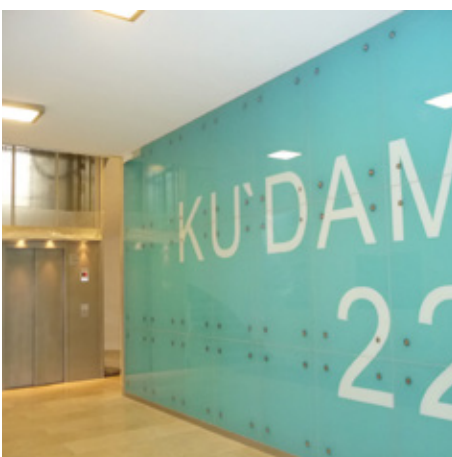
Eingangsbereich nach der Modernisierung

Commerzbank AG BIC: COBADEFFXXX IBAN: DE39 1004 0000 0179 8990 00