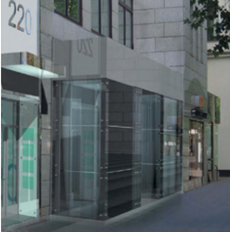
Visualisierung des Eingangsbereiches