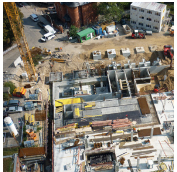
Aufsicht der Baustelle Charité Campus Mitte – Neubau OP/ITS-Gebäude

Für die Charité Mitte wird ein Neubau mit der Gebäudenummer 2728 und ein zugehöriger Verbindungsbau zum zu sanierenden Bettenhochhaus als OP/ITS-Gebäude errichtet. Der Neubau ist ein Funktionsgebäude für Operationsräume und die zugehörige Intensivmedizin. Er umfasst ebenfalls die erforderlichen Neben- und Technikräume.