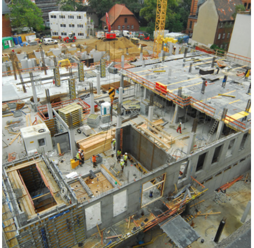
Aufsicht der Baustelle Charité Campus Mitte – Neubau OP/ITS-Gebäude